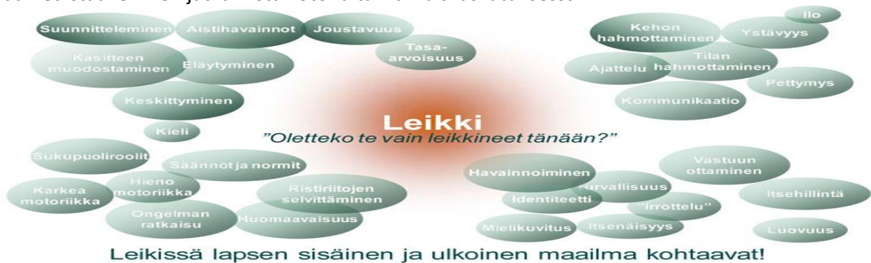
Tämän materiaalin lähde on tuntematon. Kuvan idea on saatu tukholmalaisesta päiväkodistä.

Lasten kulttuurin ja lapsille suunnatun median tunteminen auttaa henkilöstöä ymmärtämään lasten leikkejä. Myös erilaiset pelit ja digitaaliset välineet tarjoavat niihin monenlaisia mahdollisuuksia. Leikkiin kannustavassa oppimisympäristössä myös aikuinen on oppija. Henkilöstö keskustelee leikin merkityksestä ja lasten leikkeihin liittyvistä havainnoista huoltajien kanssa. Tällä tavoin voidaan edistää leikkien jatkumista kotona tai varhaiskasvatuksessa.