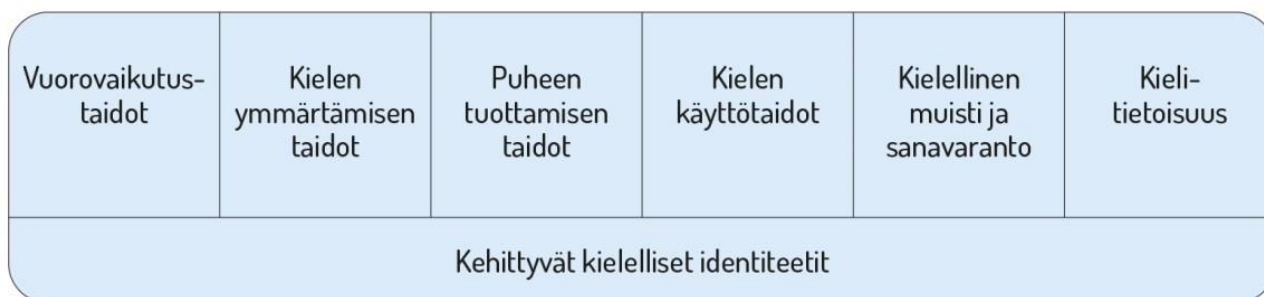
Kuvio 2. Lasten kielen kehityksen keskeiset osa-alueet varhaiskasvatuksessa (varhaiskasvatussuunnitelman perusteet 2016, 40)

Vuorovaikutustaitojen kehittymisen kannalta lasten kokemukset kuulluksi tulemisesta ja siitä, että heidän aloitteisiinsa vastataan, ovat tärkeitä. Henkilöstön sensitiivisyys ja reagointi myös lasten non-verbaaleihin viesteihin on keskeistä. Vuorovaikutustaitojen kehittymistä tuetaan kannustamalla lapsia kommunikoimaan toisten lasten ja henkilöstön kanssa.